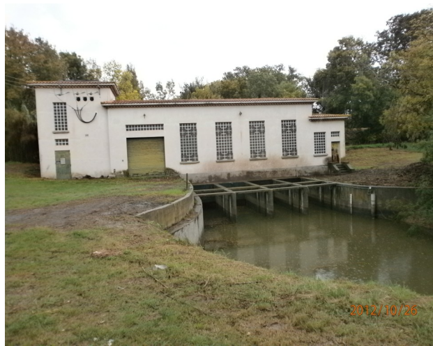
Station de pompage Pierre Du Lac

Pavillon du Canal, Chemin de Barriol, CS 30181, 13637 Arles Cedex Téléphone : 0490964491 /Télécopie : 0490499077 corregecamarguemajor@live.fr http://www.ascocorregecamarguemajor.fr