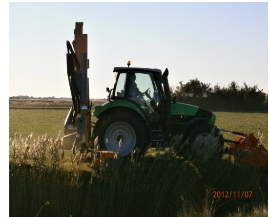
Entretien des berges par broyage.

L'ASCO doit faire face à des infrastructures vieillissantes, à la vétusté des ouvrages hydrauliques. Une grande partie du réseau présente certaines faiblesses sur les berges des canaux, une